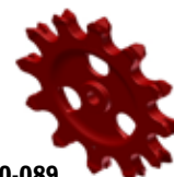
0170-089 MASTER CHAIN Приводное колесо

Мощность рассчитана на 60% заполнения и на вес в 650 кг/м 3