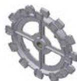
0119-168 POWERLINE Приводное колесо